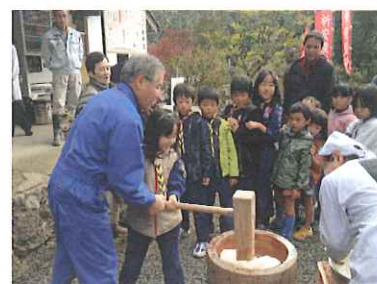
みんなでお餅つき